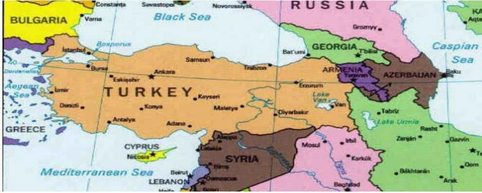
Harita 1: Şam, Halep, Diyarbakır ve Musul hilalini gösteren harita.